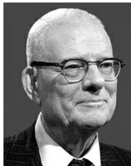
Edwards Deming, 1900-1993

Puis, aux États-Unis, un statisticien, Edwards Deming, qui avait participé dans les années 1930 à l'organisation des premières enquêtes par sondage