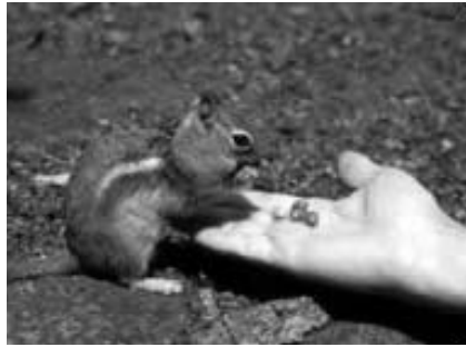
Une offre adaptée...

C'est avec le critère de pertinence ( relevance ) qu'apparaît le plus nette-