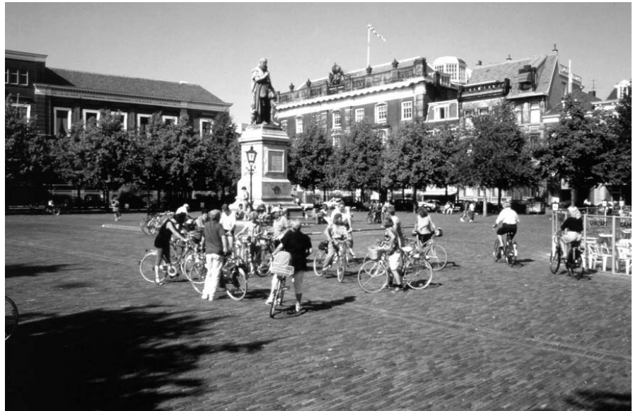
La Haye, statue de Guillaume le Taciturne

Faut-il rendre complètement cohérentes les statistiques fournies au public ? La réponse à cette question ne va pas de soi. L'examen des arguments en faveur de l'une ou l'autre solution fournit une autre façon d'étudier empiriquement la tension entre les attitudes réaliste et constructiviste. Là encore, la comptabilité nationale avait, historiquement, opté pour la confrontation et le redressement des sources, et donc pour une perspective réaliste. En effet, son principe même est de remplir, le mieux possible compte tenu des sources disponibles, des tableaux a priori cohérents et exhaustifs, décrivant l'ensemble des flux macroéconomiques d'une nation. Ces tableaux sont doublement équilibrés par construction, selon les agents et selon les opérations. Le choix de la mise en cohérence au niveau macroéconomique est donc la clé de voûte de la démarche. Il a joué un rôle décisif pour développer et améliorer les sources, en suscitant leur critique mutuelle. Il était cohérent avec l'usage de ces comptes dans des modèles keynésiens, qui ont eu leur heure de gloire entre les années 1950 et 1970. Depuis, les usages des statistiques se sont beaucoup diversifiés, et l'exigence de cohérence complète n'est plus aussi évidente.