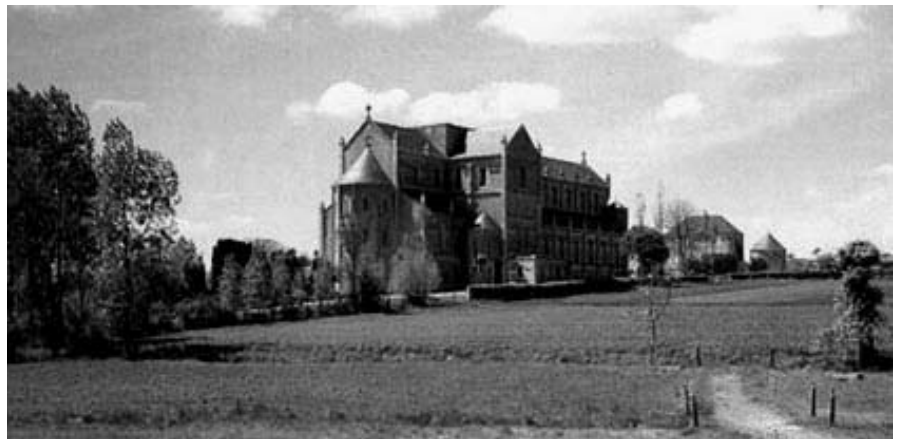
L'abbaye de Montebourg, au cœur du bocage normand