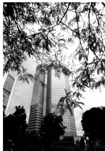
Francfort, la BCE